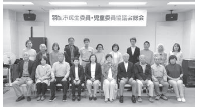
南部地区民生委員・児童委員協議会 (須影・手子林)