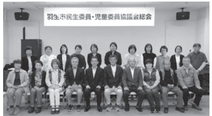
東部地区民生委員・児童委員協議会 (井泉・三田ヶ谷・村君)