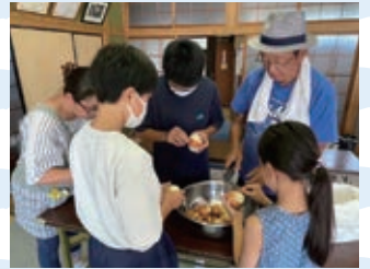
▲ボランティア体験プログラム