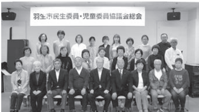
西部地区民生委員・児童委員協議会 (新郷・岩瀬・川俣)