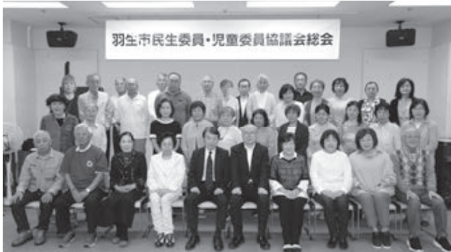
中央地区民生委員・児童委員協議会 (羽生)

総会では、昨年度の事業報告、決算とともに、新年度事業の計画、予算が審議・承認されました