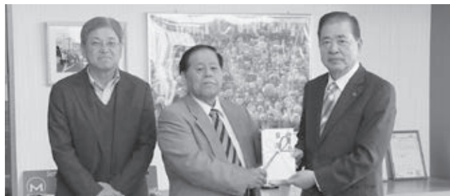
羽生ライオンズクラブ 様