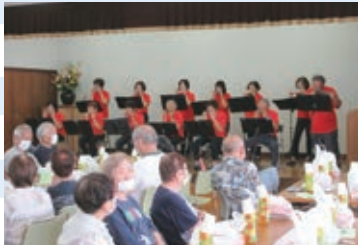
▲各地区ふれあい交流会(支部社協活動への支援)

地域の支部社協活動(ふれあい交流会、ひとり暮らし等の高齢者の見守り、地域福祉活動の活性化・企画実施等)